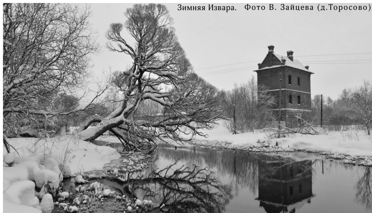
Зимняя Извара. Фото В. Зайцева (д.Торосово)

● ОТДАМ 2 пушистые 6-метровые ЕЛИ с частного участка в г. Волосово. Т.: 8-981-887-22-61