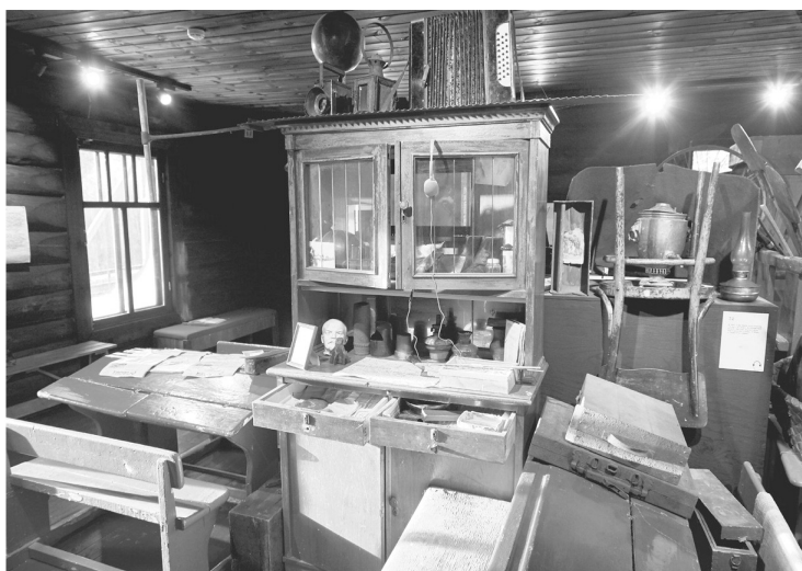
Школьные парты, мебель и старый самовар – все эти вещи из 40-х годов хранят свою память о событиях военных лет

ОТКРЫТЫЙ ПОСЛЕ РЕКОНСТРУКЦИИ МУЗЕЙ «АСТРАЧА, 1941» ЖДЁТ ГОСТЕЙ НА НОВУЮ ЭКСПОЗИЦИЮ О ВЕЛИКОЙ ОТЕЧЕСТВЕННОЙ ВОЙНЕ